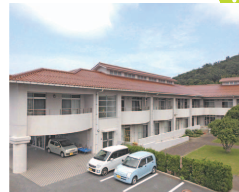
養護老人ホーム みゆき荘 サポートセンターみゆき みゆき荘デイサービスセンター