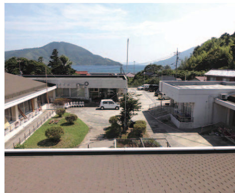
特別養護老人ホーム 和光苑